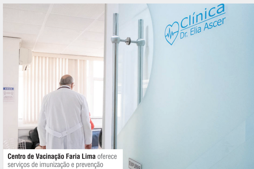
Centro de Vacinação Faria Lima oferece serviços de imunização e prevenção